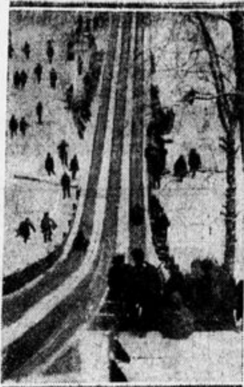
С бешеной скоростью летят сани вниз по жолобу.