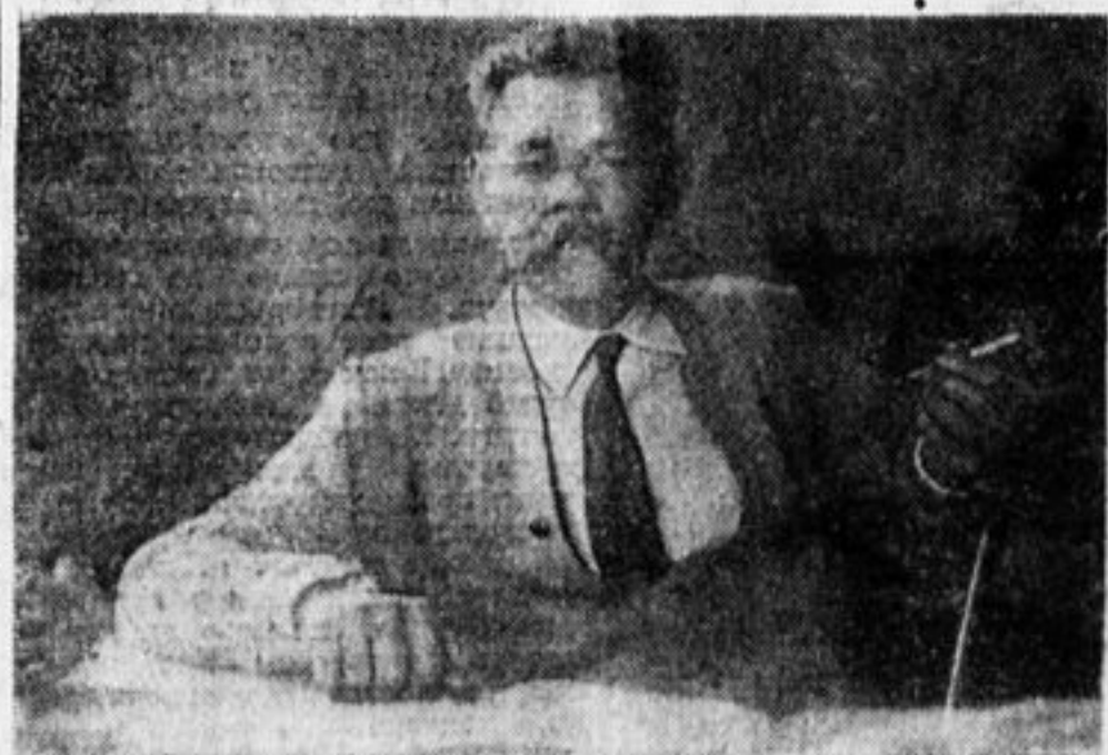
Один из лучших русских писателей.

ство». К избитому Алеше приходит работник, веселый Цыганок, и развивает целую систему, как нужно держать тело под розгой епископа, чтобы не так больно было. Засучив рукав, показывает всю в шрамах руку: это он подставлял ее нарочно под дедову розгу, чтобы меньше ударов падало на Алешу. Никогда не забудет Горький показать среди злости старорежимного мира пример высокой человечности, любви и геройства. Темна и дика была жизнь, но человек побеждал ее. Этот же Цыганок умел лихо, до самозабвения плясать, любил