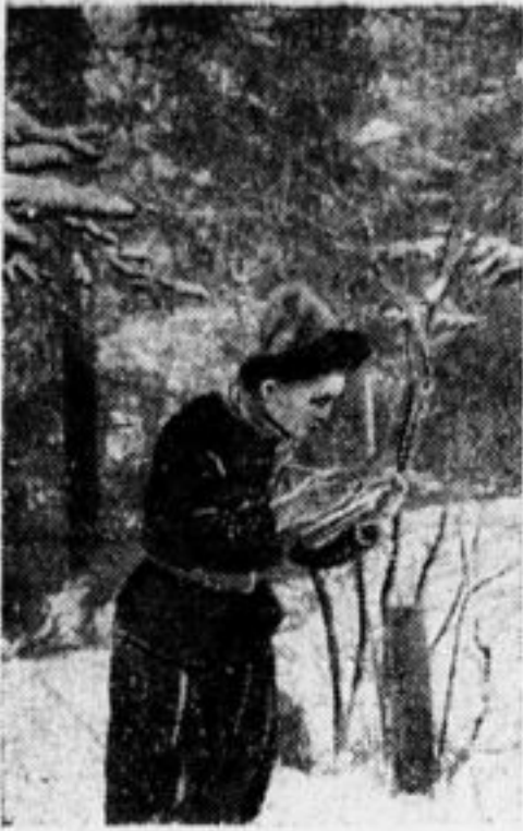
Натуралист за работой.

Это было в 1923 г. Пионеров тогда было немного, а отряды можно было сосчитать по пальцам. Тем не менее отряды эти были крепкие, спаянные, не замыкались в своей скорлупе и все шире и шире начинали работать среди неорганизованных.