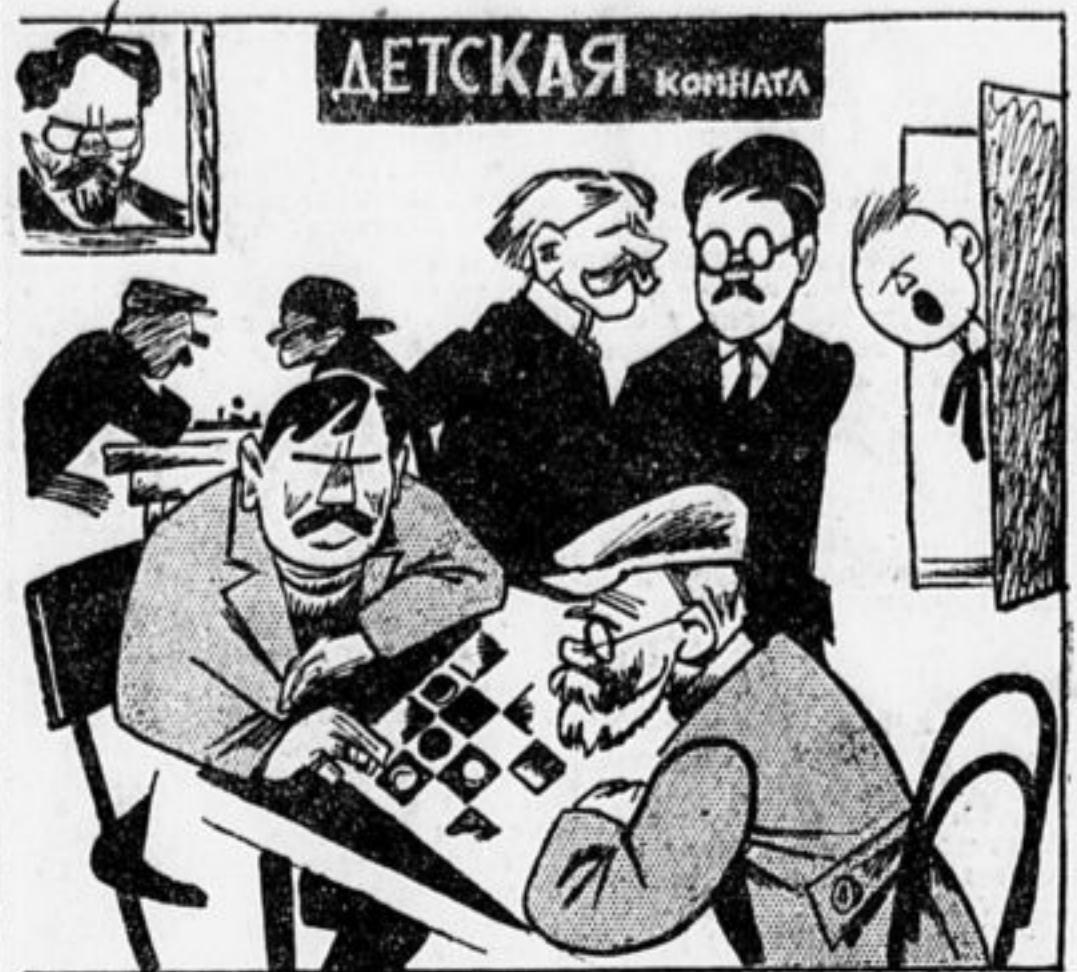
Удивляются ребята в отряде: ЧТО ТВОРИТСЯ НА СВЕТЕ? В «детской комнате» — взрослые дяди, все, кто угодно, только не дети.

Как вы добились комнаты для внешкольной работы при клубе.