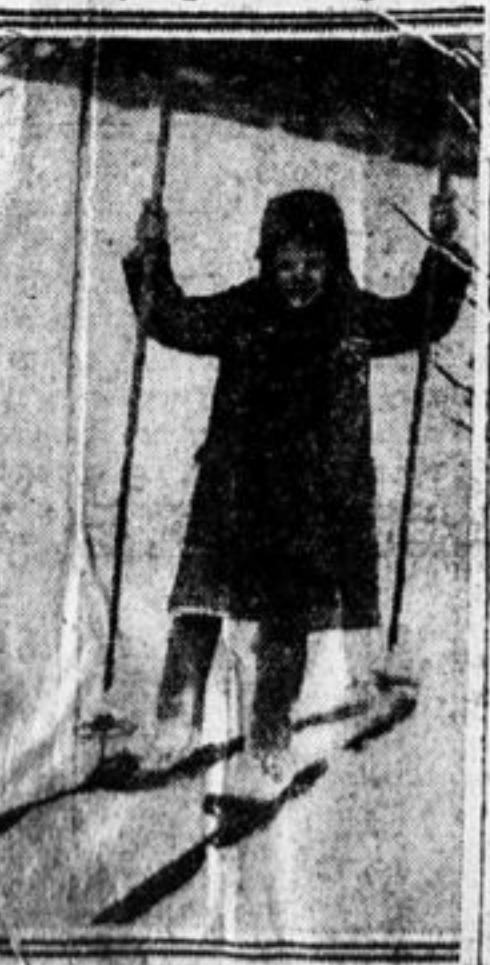
«Пионерская Правда» на лыжах