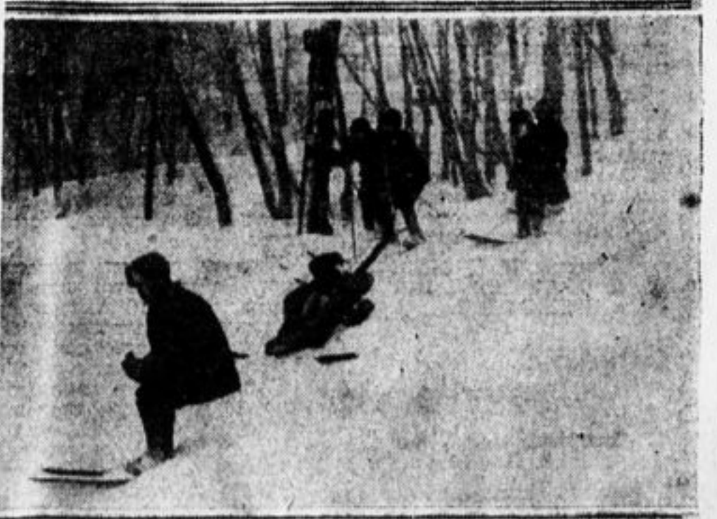
Лихо мчатся с ветром вперегонки.