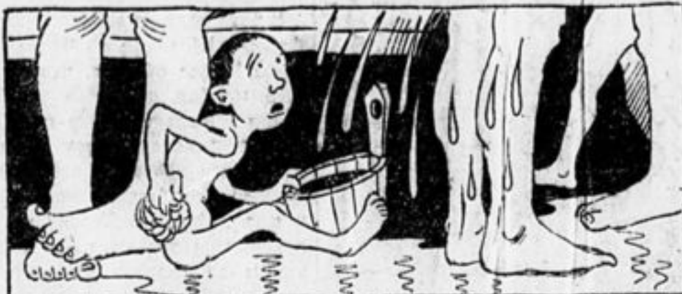
Много взрослых в бане Задавили Ваню. Испускает Ваня стон.

Взгляните на карикатуру. Народу полно. Ребятам приходится ютиться на полу—между ног. Грязная вода со взрослых стекает прямо в таз, толчки в бок и ругань в воздухе — вот обстановка, в которой приходится мыться. Да еще к тому же нет уверенности, что моются только здоровые.