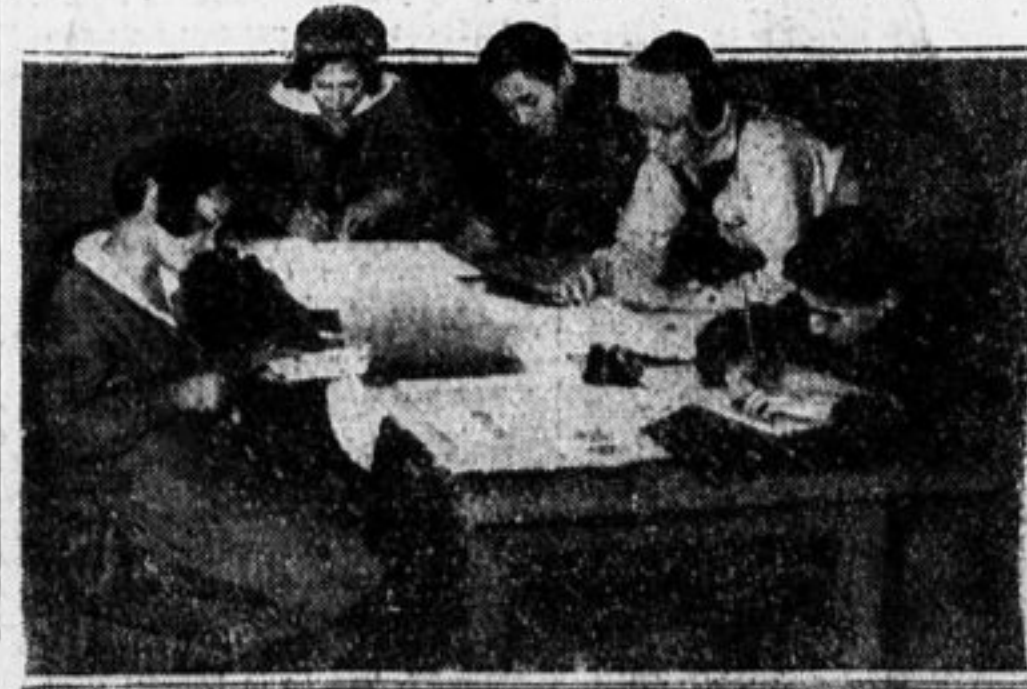
В своей комнате работает лучше.

ванные. Работа кружка видна повсюду: вот расторопный дежурный помогает двоим малышам выбрать нужные книги, вот висят несколько плакатов, рекомендуемых книги для чтения. Иногда устраиваются громкие читки, иногда туманные картины.